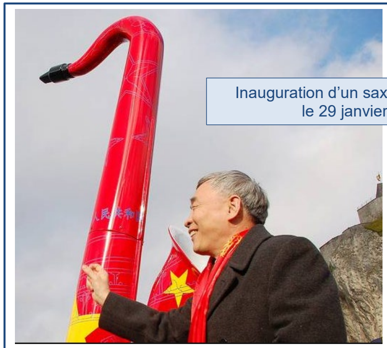
Inauguration d'un saxophone chinois le 29 janvier 2017